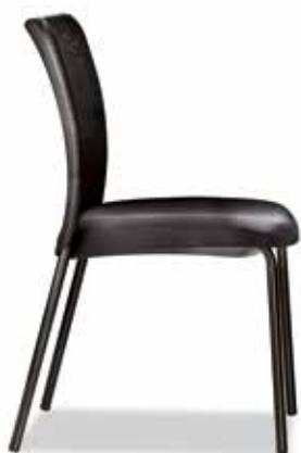
VO 92860 000 Vierbeiner ohne Armlehnen

Gestell schwarz, 4fach stapelbar (inkl. Stapelschutz)